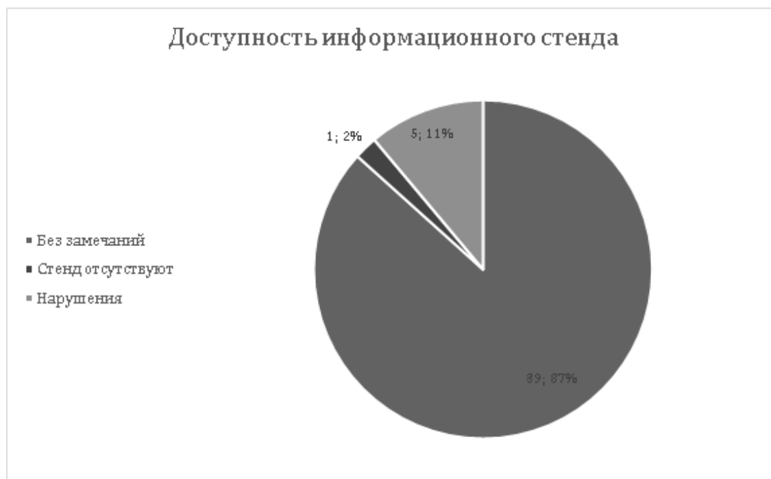
Рисунок 1 – Доступность информационного стенда в подразделениях полиции [Отчет по результатам мониторинга отделений полиции в Москве, 2018]

Участники кампании обращали внимание на открытость участков; доступность и инклюзивность, в том числе, для маломобильных, слабослышащих и слабовидящих граждан, и на актуальность информации об отделениях в Интернете и на информационных стендах на территории ОВД. Так, из 45 проверенных подразделений полиции только в одном отсутствует информационный стенд, а в 5 (10%) случаях выявлены нарушения при его организации: стенд расположен за решёткой либо иными препятствиями, с частичным нарушением доступа, недостаточным освещением, в неподходящих местах или неудобочитаемый.